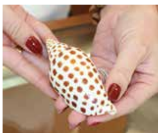
Las conchas junonia son raras y preciosas, y la familia tiene una real en exhibición en la tienda de Fort Myers.