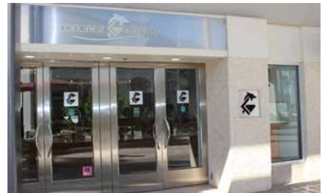
Puedes encontrar la tienda de Congress Jewelers en Fort Myers dentro del centro comercial The Bell Tower, en South Cleveland Avenue.

El amor de la familia Congress por las personas y la comunidad se evidencia constantemente en la forma en que retribuyen —