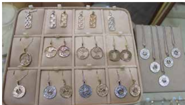
Una línea de colgantes con diseños “Sanibel Strong” fue creada tras el huracán Ian, ayudando a recaudar cerca de $50,000 para obras benéficas.

Encontrar una concha junonia en la playa es como hallar un trébol de cuatro hojas. Y sí, hay una encontrada por la familia en exhibición cerca de la colección Birthshell en la tienda de Fort Myers.