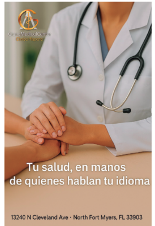
13240 N Cleveland Ave · North Fort Myers, FL 33903

Ubicación: 13240 N Cleveland Ave, North Fort Myers, FL 33903 Teléfono: (239) 599-4986 ✉: gianamedicalcenter@gmail.com