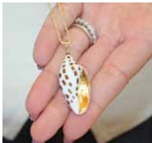
Este colgante de concha junonia muestra la exquisitez del diseño, el trabajo artesanal y los detalles de la joyería.

Febrero, por ejemplo, une la concha tulipán con amatista. Mayo se engalana con la codiciada y rara concha junonia, adornada con esmeralda.