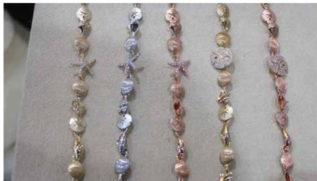
Pulseras llamativas forman parte de la colección SeaLife By Congress.