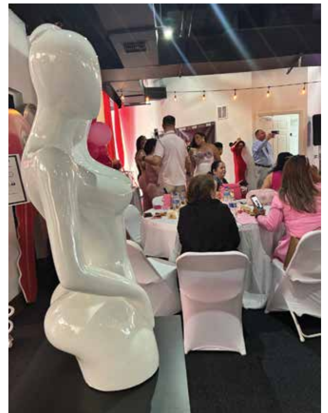
Un encuentro que reunió a cerca de 100 mujeres.