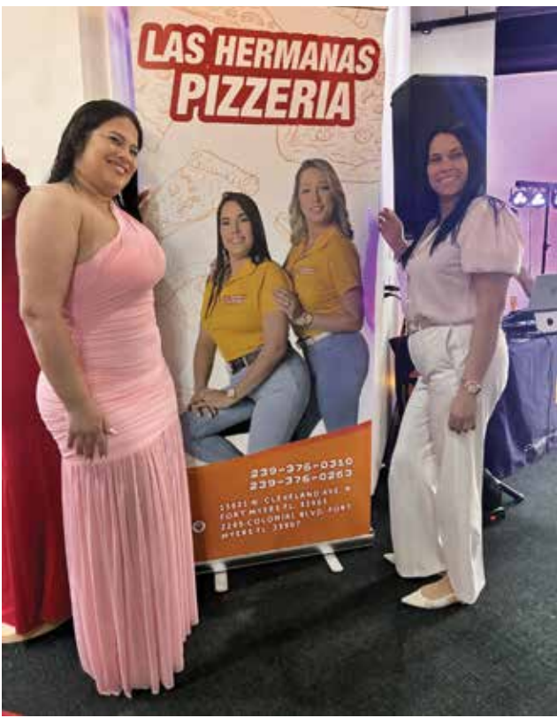
El apoyo de varios negocios locales fortaleció este evento inaugural