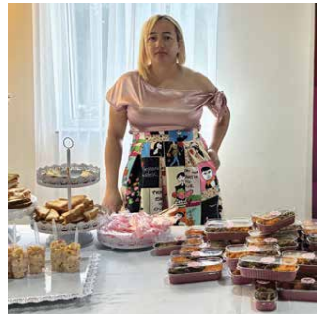
El Pílon Playero aportó sabor local.