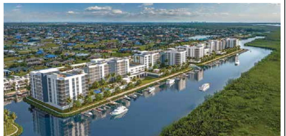
Luz verde a Seven Islands en la página 3