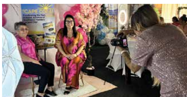
Nadie quiso irse sin una foto en el set de The Cape Coral Sun.