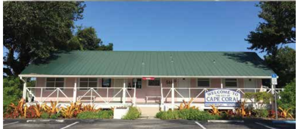
Entonces y ahora. Arriba: Tienda provisional (pro shop) y área de refrigerios del Country Club (inicios de la década de 1960). Abajo: Edificio Rosen del Museo de Historia de Cape Coral (actualidad). Después de trasladarse al parque Four Freedoms en 1966, el edificio fue movido nuevamente al Cultural Park en 1983 y abrió como el edificio original del museo en 1987.

“Si no sabes de dónde vienes, no sabes hacia dónde vas”, afirmó.