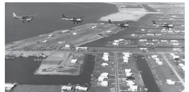
Foto aérea de aviones sobre Cape Coral.

Con el museo mostrando de manera constante aquello que ha hecho único al Cape, puede seguir desempeñando un papel fundamental para asegurar que la trayectoria futura de la ciudad siga avanzando y mantenga al Cape como un lugar que su comunidad adora.