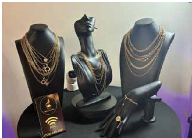
Las piezas de Bola de Oro añadieron un toque de lujo al evento.