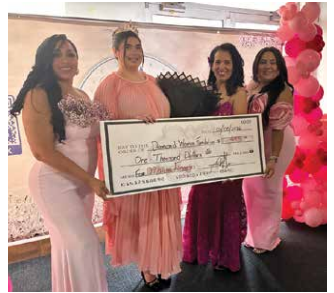
La recaudación de fondos de este primer evento marcó el inicio de una misión solidaria.