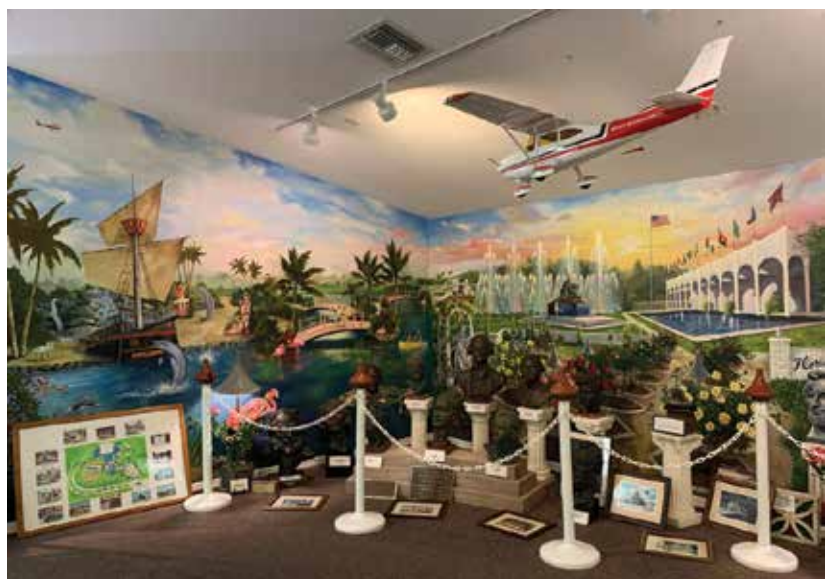
Mural de GAC Cape Coral Gardens