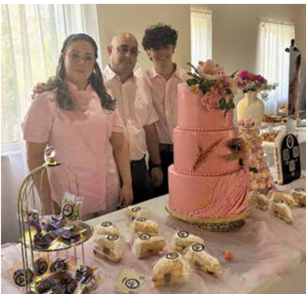
Fabio's Cake Studio sorprendió con su exquisita repostería de lujo.