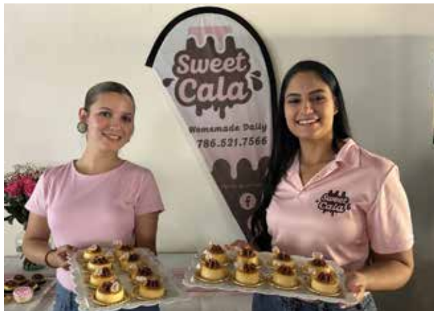
El talento de jóvenes emprendedoras también brilló.