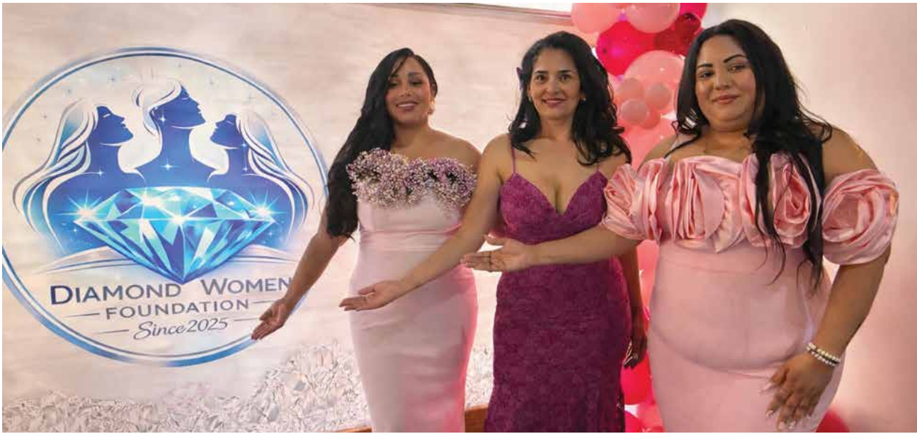
El nacimiento de una fuerza femenina