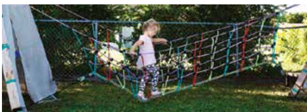
Patio trasero sensorial-amigable

Ahí es exactamente donde Foster Village SWFL interviene con más fuerza.