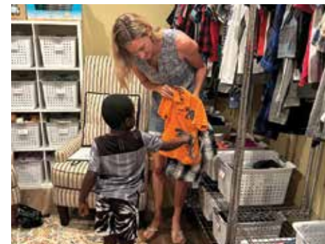
Los niños pueden elegir sus propias cosas.

Las familias de acogida tradicionales son aquellas que se han preparado logística y emocionalmente. Han tomado clases, organizado su hogar y se han asegurado de tener todo listo para recibir a los niños.