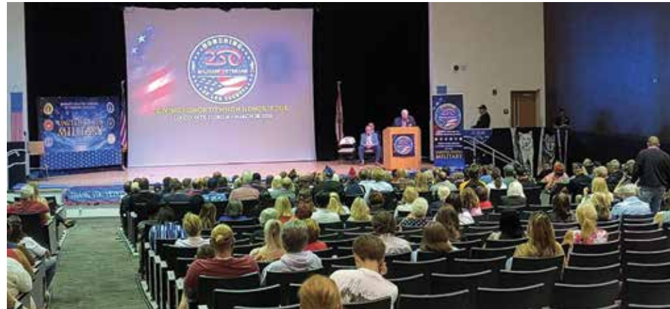
Unos 180 militares y veteranos asistieron para recibir su reconocimiento. El vicegobernador Jay Collins fungió como

La comunidad del condado de Lee se reunió recientemente para rendir homenaje a 250 militares y veteranos locales, en una ceremonia que celebró el servicio y sacrificio de quienes han defendido al país. El homenaje también puso de relieve el origen diverso de las familias que, a lo largo de los años, han contribuido de múltiples maneras a las Fuerzas Armadas de Estados Unidos.