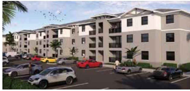
Civitas Cape Coral

Hermosa ya comenzó a alquilar sus 160 unidades para personas de 62 años o más. Avis Square, planificado cerca de Hancock Parkway al sur de Pine Island Road, ofrecerá sus 121 unidades a residentes de 55 años o más.