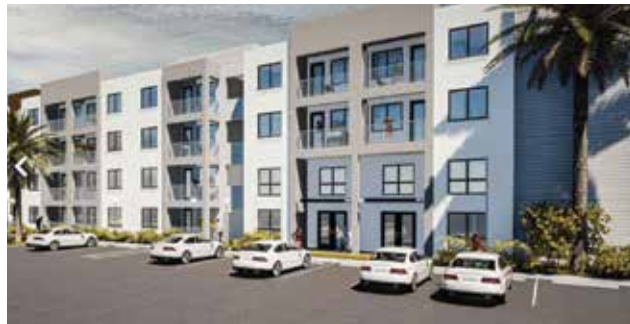
Hermosa North Fort Myers

Otros desarrollos incluyen Town Home Suites by Marriott y la nueva sede de Bones Coffee, un edificio de 100,000 pies cuadrados para su operación global de empaque y envío.