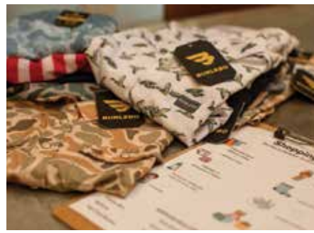
Todos los artículos son nuevos y provienen de la comunidad.