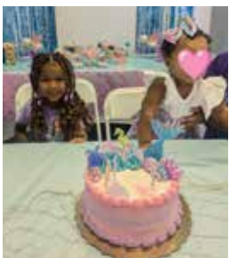
Fiestas Hearten de Foster Village SWFL

Así nació Foster Village SWFL, con Hearten permaneciendo como un programa dentro de la organización para continuar celebrando cumpleaños y otros hitos, apoyando a los cuatro tipos de situaciones que atienden: acogida tradicional, cuidado por familiares (kinship), adopción y reunificación.