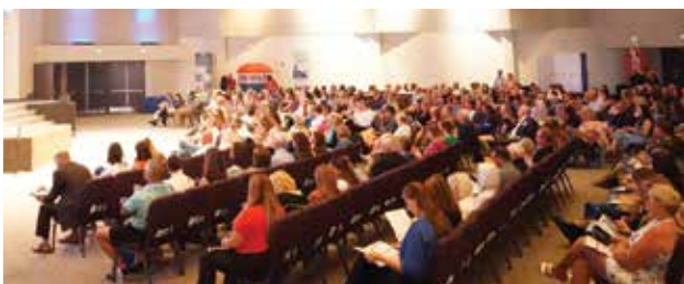
Muchos residentes asistieron al evento Catch The Vision