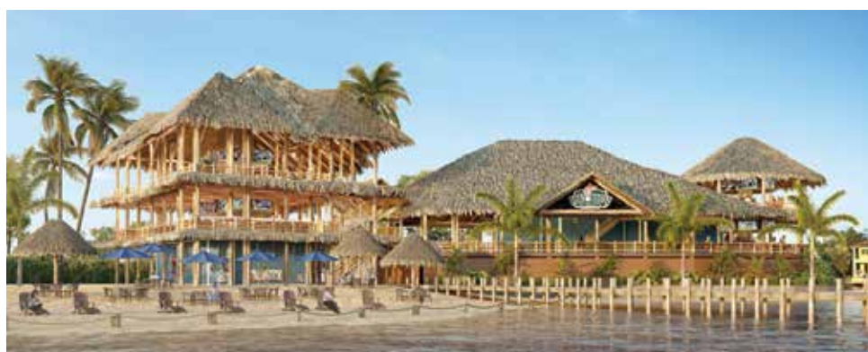
Representación del diseño del restaurante Boat House