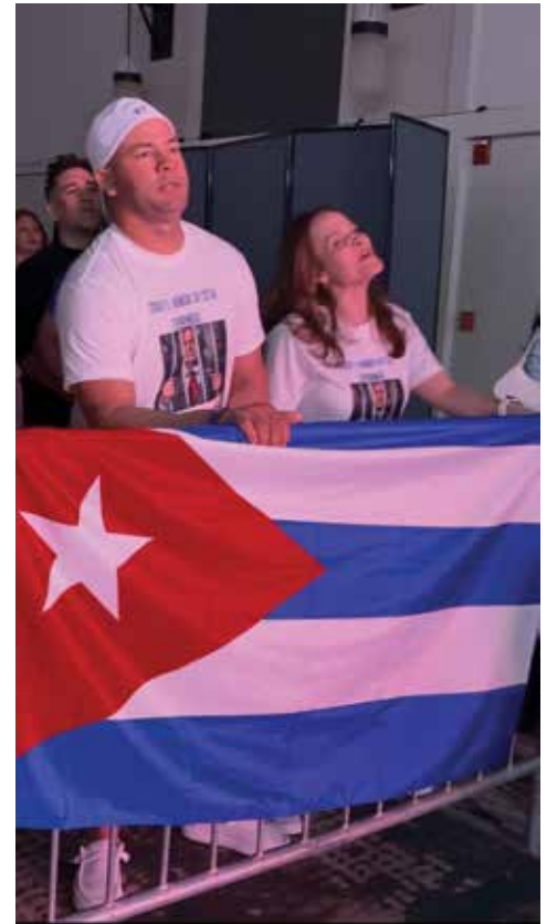
La bandera cubana no podía faltar en una noche como esta, símbolo de memoria, orgullo y libertad para toda la comunidad.