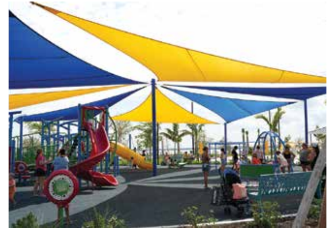
Jaycee Park, 4215 SE 20th Pl., Cape Coral, FL 33904